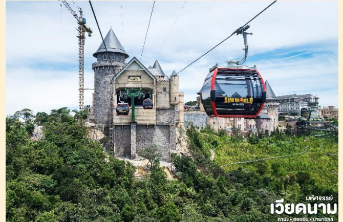
เม็คจรรย เวียดนาม ดานัง • ออยอัน • บาน่าฮิลล์

นำท่าน นั่งกระเช้าขึ้นสู่บาน่าฮิลล์ กระเช้าแห่งบาน่าฮิลล์นี้ได้รับการบันทึกสถิติโลกโดย World Record ว่าเป็นกระเช้าไฟฟ้าที่ยาวที่สุด ประเภท Non Stop โดยไม่หยุดแวะ มีความยาวทั้งสิ้น 5,042 เมตร และเป็นกระเช้าที่สูงที่สุด 1,294 เมตร นักท่องเที่ยวจะได้สัมผัสสลุยเมฆหมอกและบางจุดมีเมฆลอยต่ำกว่ากระเช้าพร้อมอากาศบริสุทธิ์อันสดชื่นจนทำให้ท่านอาจลืมไปเสียด้วยซ้ำว่าที่นี่ไม่ใช่ยุโรป เพราะอากาศที่หนาวเย็นเฉลี่ยตลอดทั้งปีประมาณ 10 องศาเท่านั้น จากนั้นนำท่าน ชม สะพานสีทอง สถานที่ท่องเที่ยวใหม่ล่าสุดตั้งโดดเด่นเป็นเอกลักษณ์อย่างสวยงาม บนเขากาน่าฮิลล์ นำท่านสู่จุดที่สร้างความตื่นตะลึงให้นักท่องเที่ยวมองดูอย่างอึ้งการที่ซึ่งเต็มไปด้วยเสน่ห์แห่งตำนานและจินตนาการของการผจญภัยที่