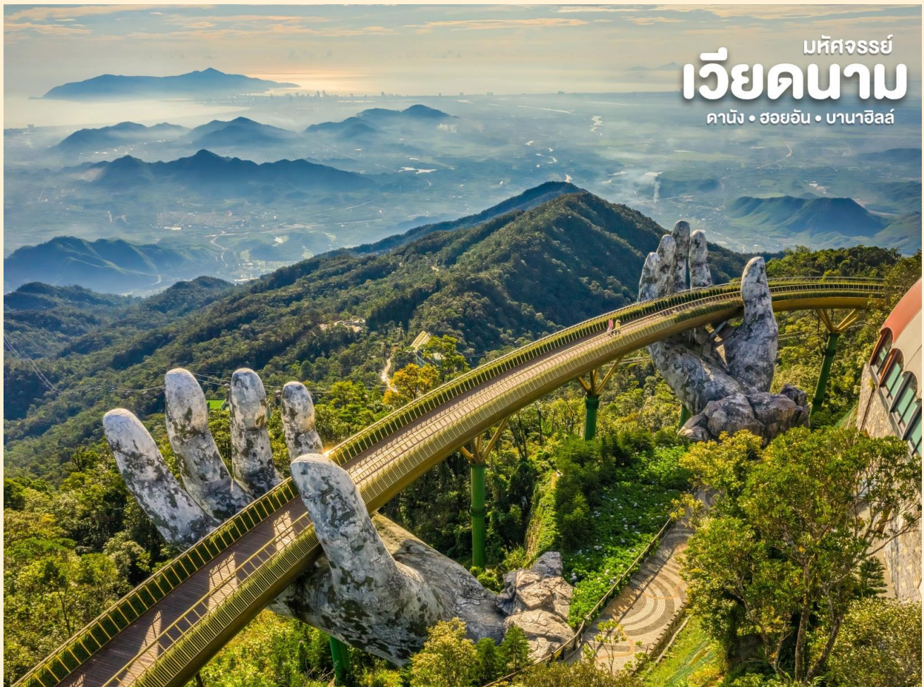
เม็คจรรย เวียดนาม ดานัง • ออยอัน • บาน่าฮิลล์